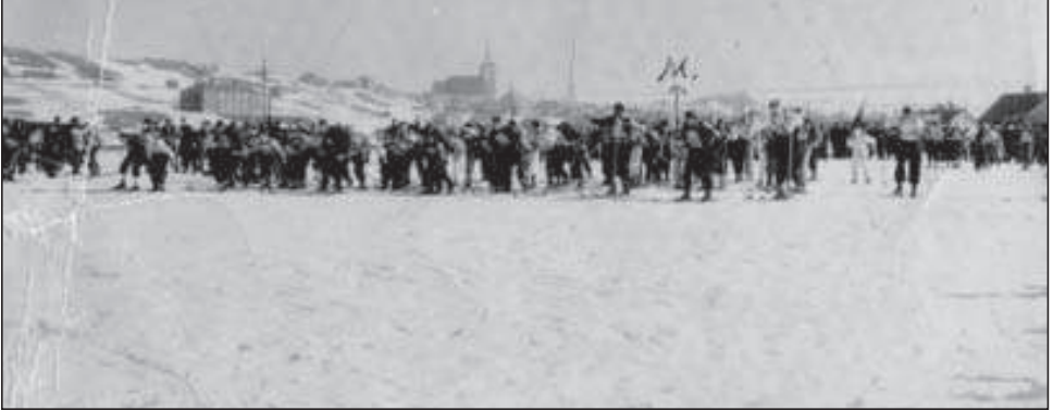
Starten går på Røros ett av de aller første åra.